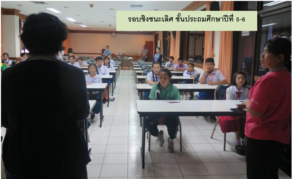
รอบชิงชนะเลิศ ชั้นประถมศึกษาปีที่ 5-6