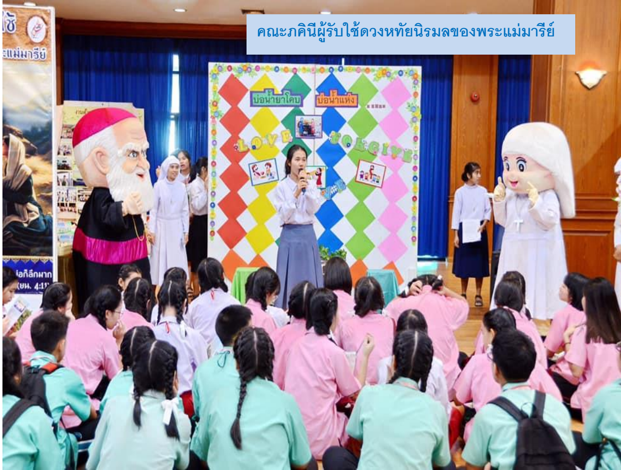
คณะภคินีผู้รับใช้ดวงหทัยนิรมลของพระแม่มาเรีย