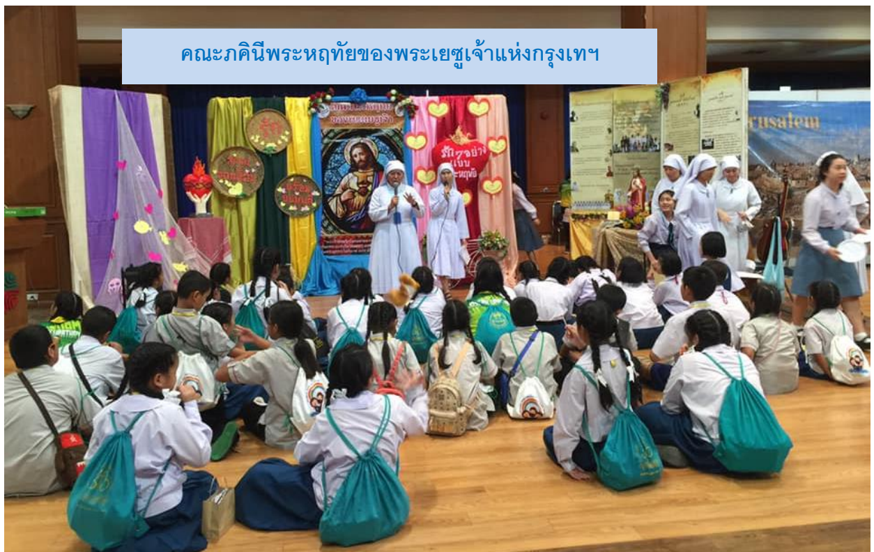
คณะภคินีพระหฤทัยของพระเยซูเจ้าแห่งกรุงเทพฯ