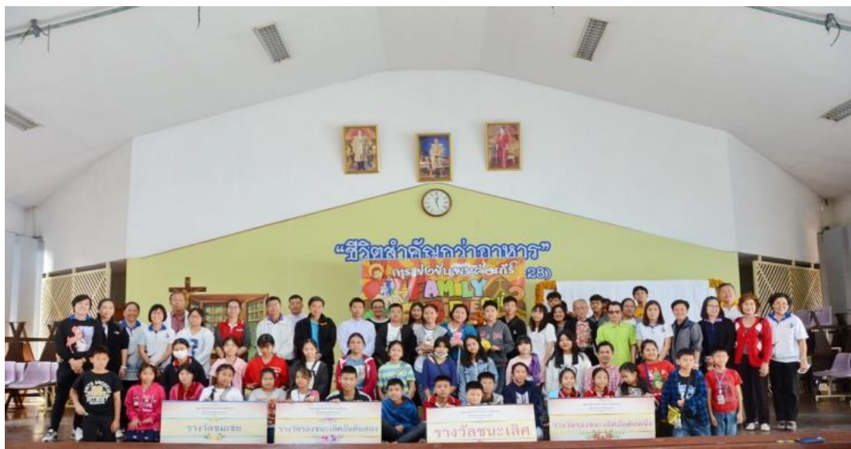
Family Bible Quiz 2019 วัดพระแม่สกตสงเคราะห์ บางบัวทอง วันอาทิตย์ที่ 8 ธันวาคม 2019 / 2562

4.2 ร่วมกับวัดพระแม่สกตสงเคราะห์ เขต 3 วันที่ 8 ธันวาคม 2019 จำนวน 36 ทีม ๆละ 2 คน รวมเป็น 72 คน ครูคำสอน จำนวน 6 คน สามเณรใหญ่ 2 ท่าน เจ้าหน้าที่แผนกพระคัมภีร์และแผนกคริสตศาสนธรรม จำนวน 4 คน ทั้งหมด 84 คน ณ วัดพระแม่สกตสงเคราะห์