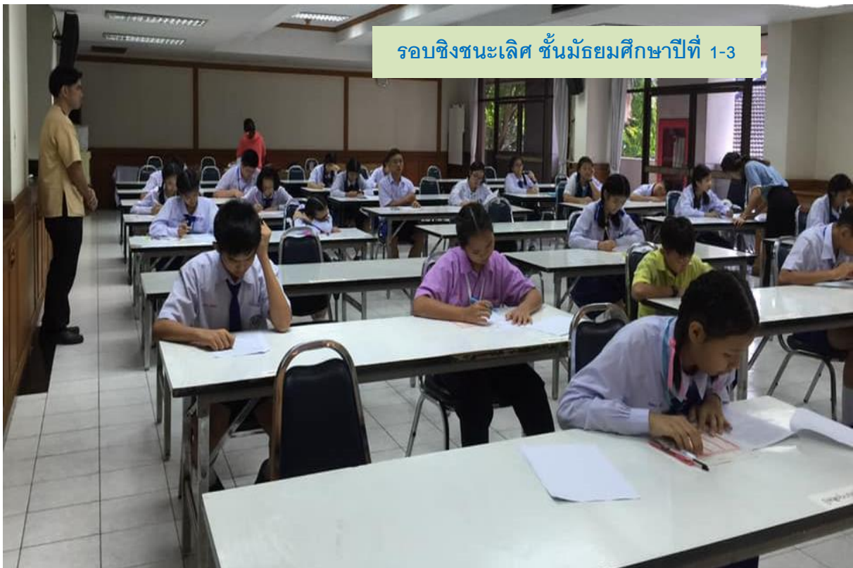
รอบชิงชนะเลิศ ชั้นมัธยมศึกษาปีที่ 1-3