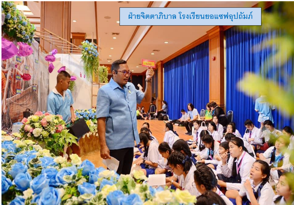
ฝ่ายจิตตภาบาล โรงเรียนขอแซฟอุปถัมภ์