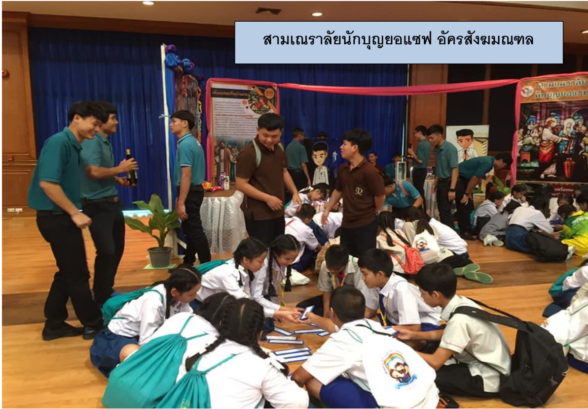
สามเณรลัทธินักบุญอแซฟ อัครสังฆมณฑล