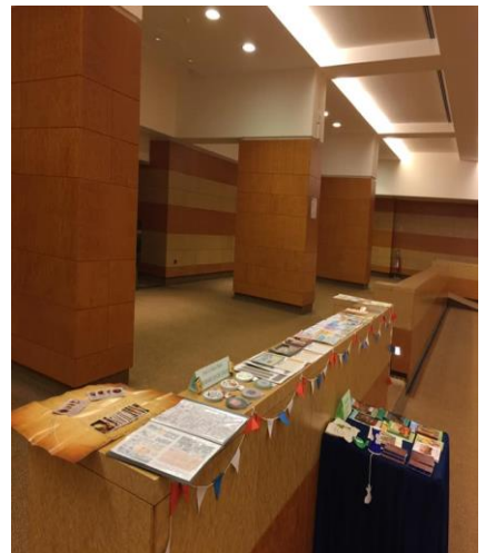
สื่อพระคัมภีร์: จากแผนกพระคัมภีร์ อัครสังฆมณฑลกรุงเทพฯ และแผนกพระคัมภีร์ สังฆมณฑลจันทบุรี ที่นำไปแสดงที่ประชุมฯ