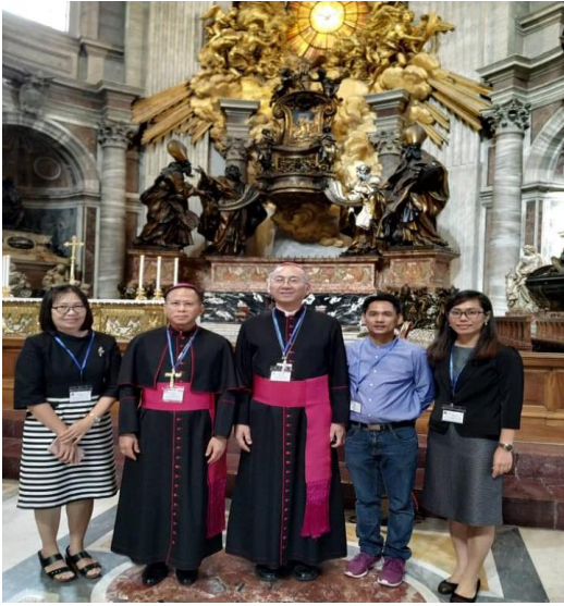
สมาชิก CBF จากประเทศไทย 5 ท่านเข้าร่วมประชุมฯ