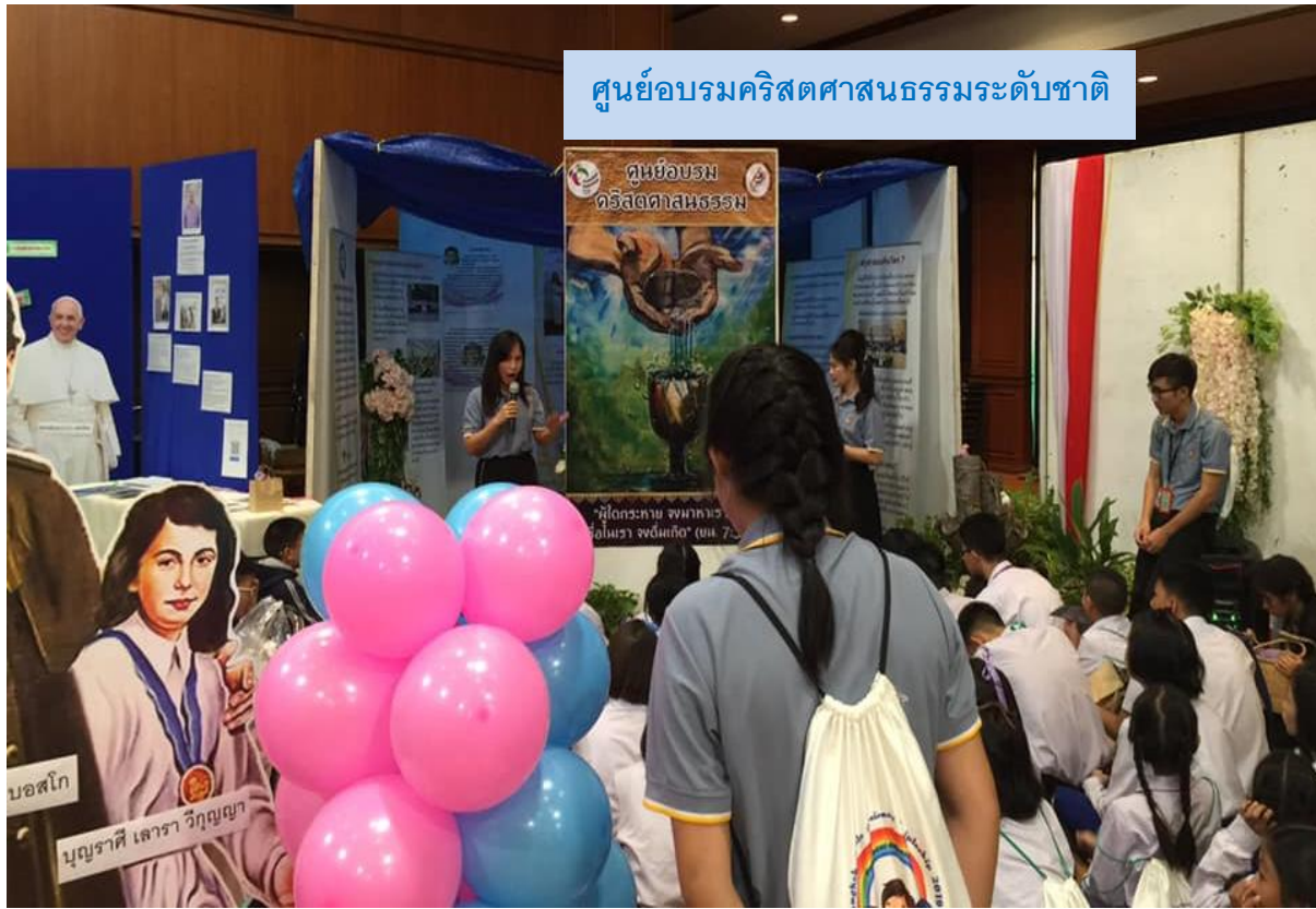
ศูนย์อบรมคริสตศาสนธรรมระดับชาติ