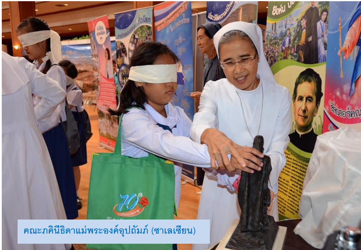
คณะภคินีธิดาแม่พระองค์อุปถัมภ์ (ซาเลเซียน)